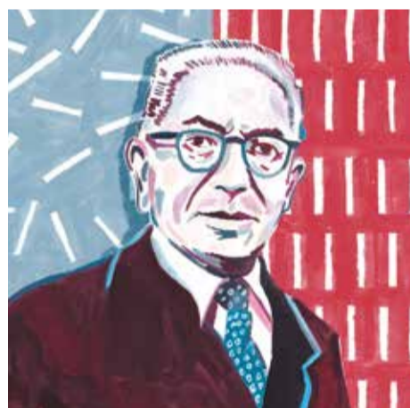
Isidor Isaac Rabi